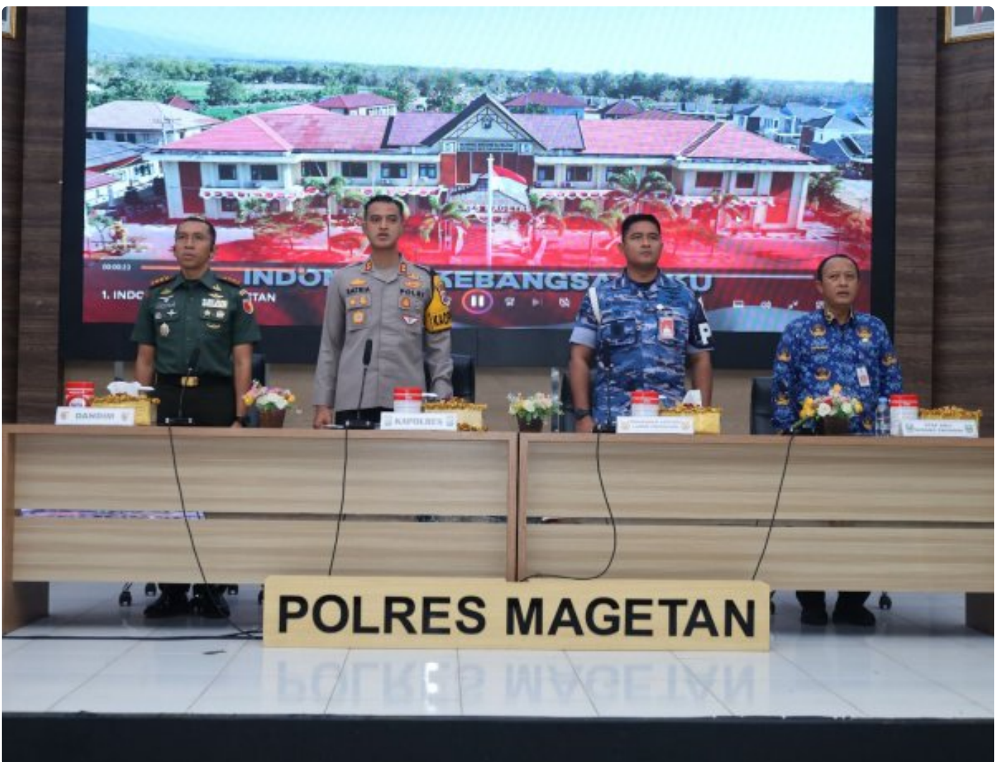
Dandim 0804/Magetan Hadiri Rakor Lintas Sektoral kesiapan operasi lilin 2024

Magetan. – Guna meningkatkan Sinergitas dalam rangka kesiapan operasi lilin 2024 pengamanan Hari Raya Natal 2024 dan Tahun Baru 2025 di wilayah Kabupaten Magetan yang aman dan kondusif.